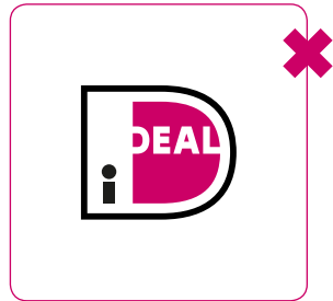
Onderdelen van logo nooit onafhankelijk van elkaar schalen