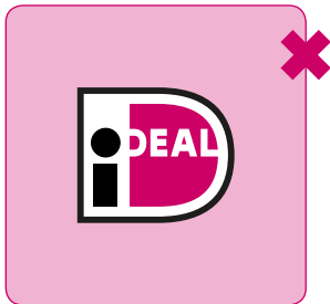
Nooit de witte rand uit het logo weghalen