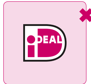
Logo nooit van kleur veranderen