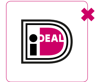
Aan logo geen elementen toevoegen