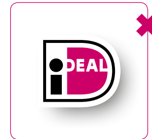
Logo geen schaduw geven