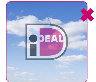
Logo niet transparant maken