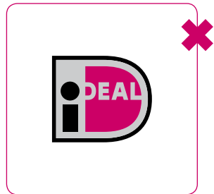
Logo niet vullen met een kleur