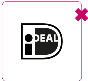
Logo nooit in één kleur veranderen