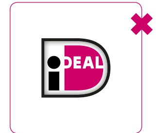
Logo geen ander effect geven