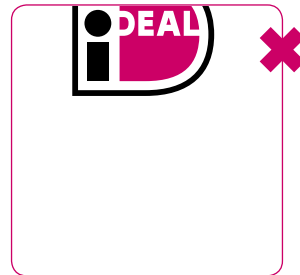
Logo nooit aansnijden